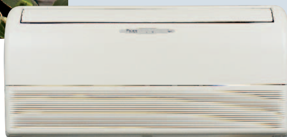
Вътрешно тяло на FLKS/FLXS