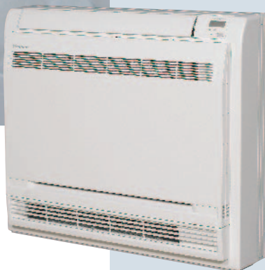
Вътрешно тяло на FVXS