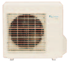
RKS/RXS 50 G