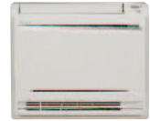
FVXS 25, 35, 50 F